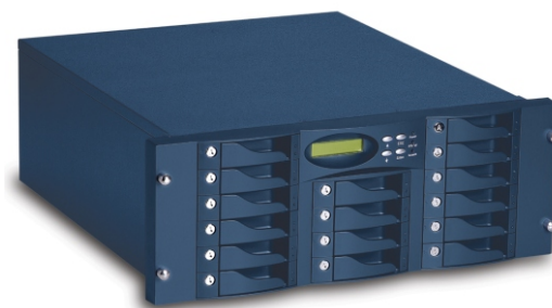
NNAS Rack Mount